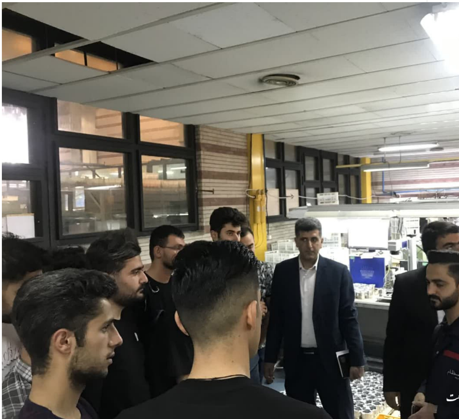
گروه کارآفرینی و ارتباط با صنعت دانشکده فنی و حرفه ای تبریز